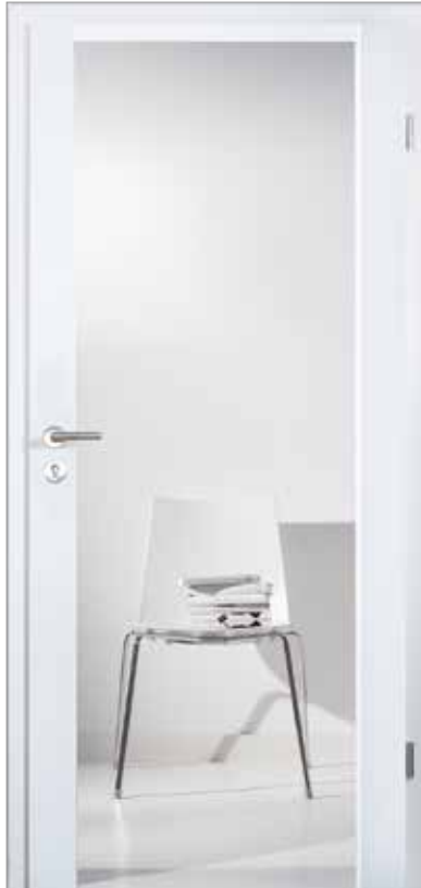
2501 mit dreiseitigem Fries Klarglas