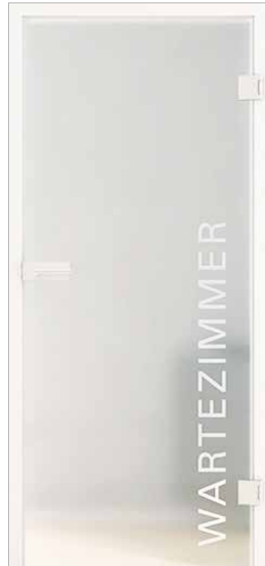
Lasertechnik Beispiel Arztpraxis