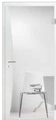
2601* mit gebogenem Fries Klarglas