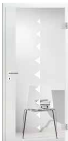
2600 mit geradem Fries Glas Dreiecke einreihig