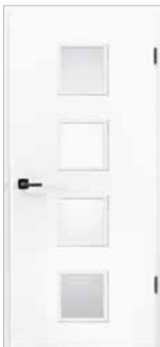
Optima LÖ 14 Weiß lackiert WL10 (nach RAL 9010)