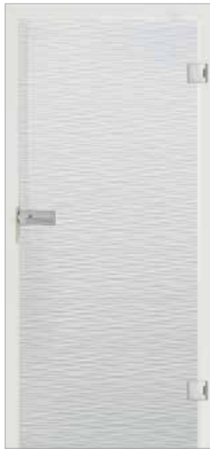
Carisma 30-2 Weißglas