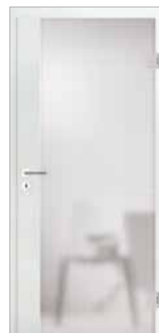
2600 mit geradem Fries Glas Mastercarré weiß

Indem der Fries ausschließlich auf der Schlosseite liegt, nimmt sich das Holz aufs Minimum zurück und rückt das elegante Glas in den Vordergrund. Das verleiht den Holzglastüren 2600 und 2601 die einzigartige Design-Nuance.