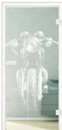
Lasertechnik Beispiel individuelles Bild