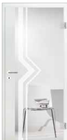
2600 mit geradem Fries Dekorglas Weimar