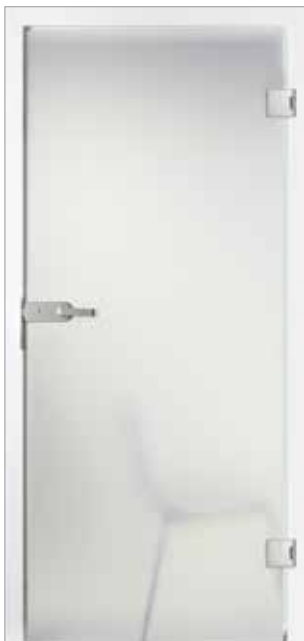
Basic 2 Satinato