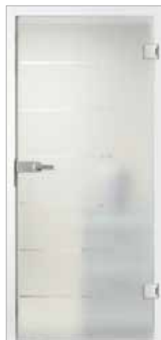
Basic 49-3 Satinato/Klarglas