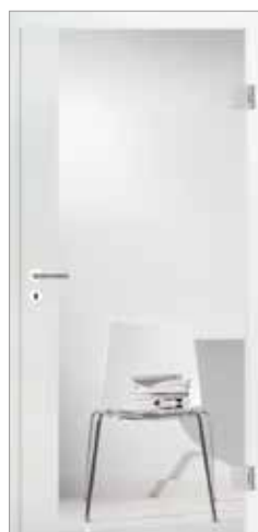
2600 mit geradem Fries Klarglas