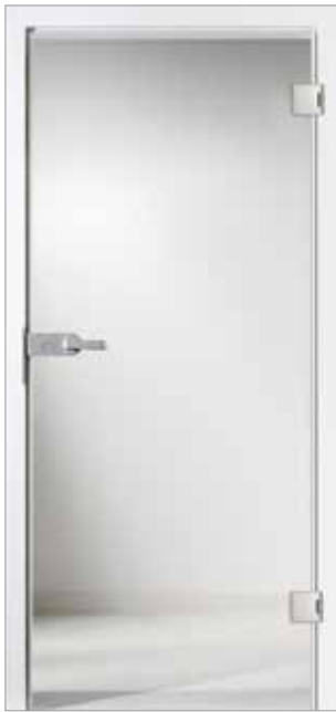
Basic 2 Klarglas