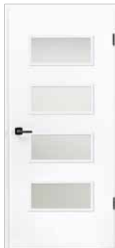
Optima LÖ 40 DuriTop Uni Weißlack (nach RAL 9010)