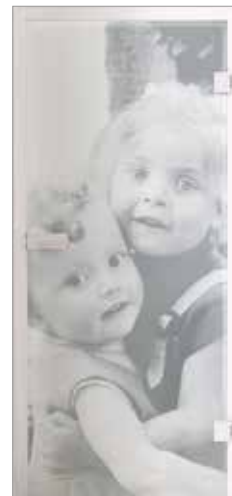
Lasertechnik Beispiel individuelles Bild