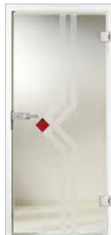
Basic 59-1 Klarglas/Satinato/Siebdruck