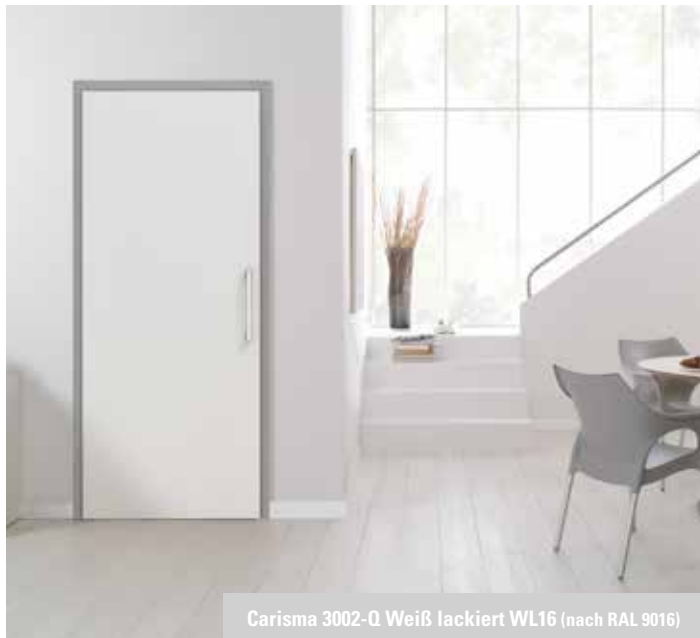
Carisma 3002-Q Weiß lackiert WL16 (nach RAL 9016)

Die Ganzglastüren Carisma sind im Designverbund auch als Trendtüren in 3D Optik erhältlich. (siehe Seite 16)