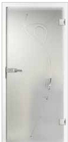
Basic 39-2 Satinato mit Rille