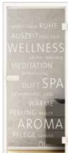
Lasertechnik Beispiel Wellness