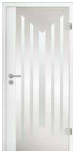
2600 mit geradem Fries Glas Visa Klar