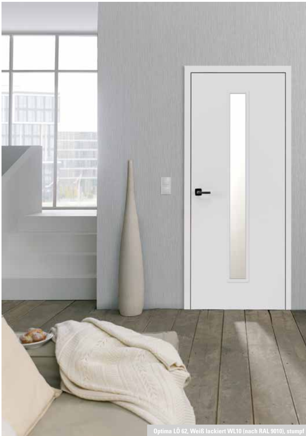
Optima LÖ 62, Weiß lackiert WL10 (nach RAL 9010), stumpf