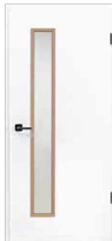
Optima LÖ 62 (schlosseitig) Brillantweiß WL16 (nach RAL 9016) Glasleiste: DuriTop Repro Kirschbaum Caffè