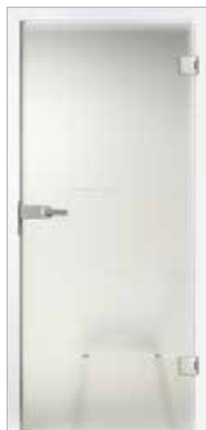
Basic 29-3 Satinato mit Rille