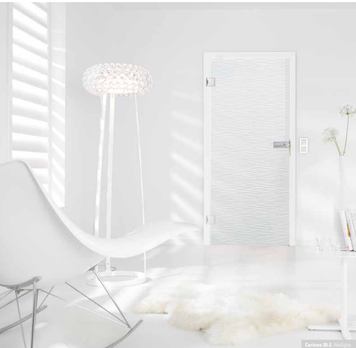
Carisma 30-2, Weißglas

Die Ganzglastüren Carisma setzen sich mit neuen Akzenten in Szene und prägen den Raum durch charaktervolles Design.