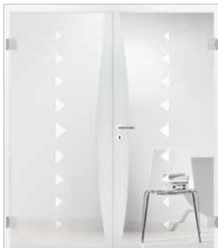
2601* mit gebogenem Fries Glas Dreiecke einreihig