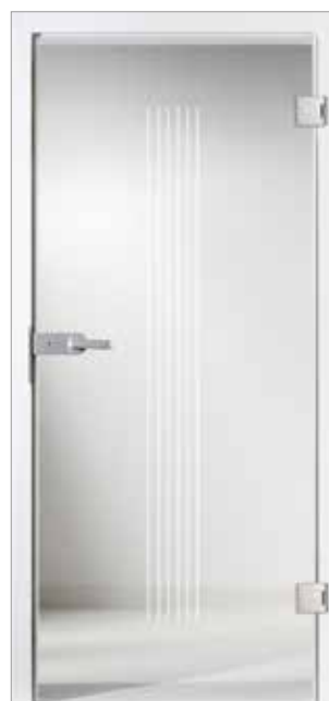
Lombardo 29-17 Weißglas