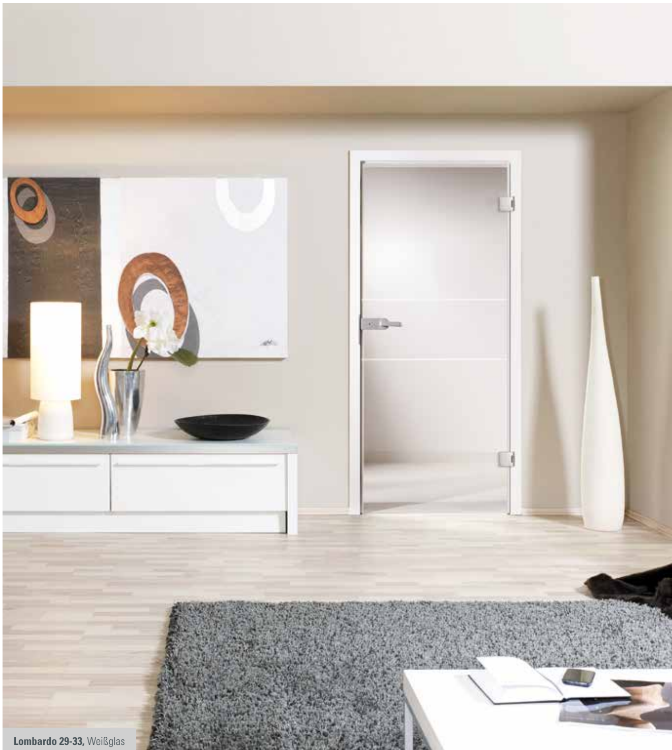
Lombardo 29-33, Weißglas

Licht ist Lebensenergie und bestimmt in vielerlei Hinsicht den Rhythmus unseres Alltags. Das Einfangen der natürlichen Lichtverhältnisse spielt auch in der Architektur eine immer wichtigere Rolle und lässt es zu einem wesentlichen Gestaltungselement im Innenraum werden.