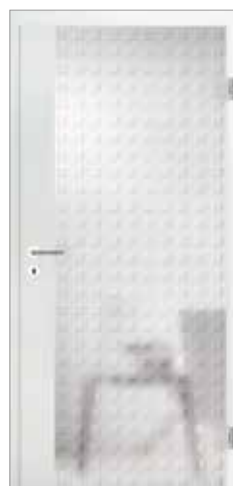
2600 mit geradem Fries Glas Quadrate beidseitig