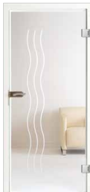
Satura 16-33 Weißglas