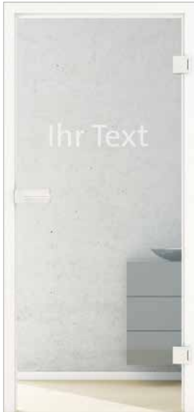
Lasertechnik Beispiel individuelle Beschriftung