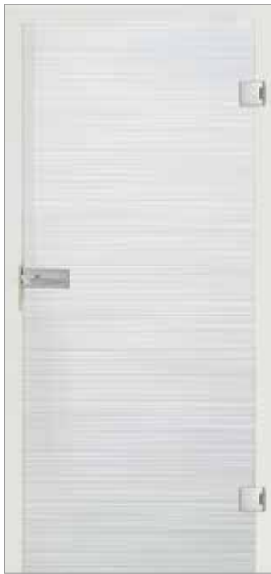
Carisma 30-1 Weißglas