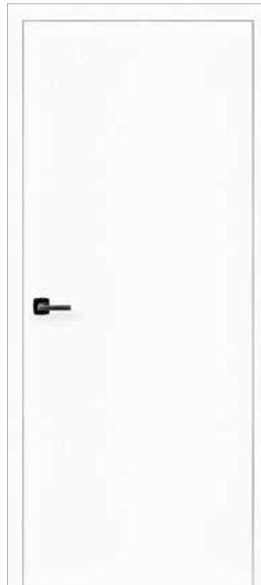
Optima 30, stumpf DuriTop Struktur StrukturWeiß Oberfläche mit haptischer Struktur