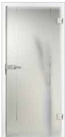
Basic 29-1 Satinato mit Rille