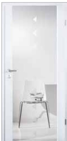
2500 mit Fries längs Glas Dreiecke einreihig