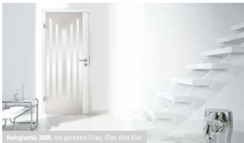
Holzglastür 2600, mit geradem Fries, Glas Visa Klar