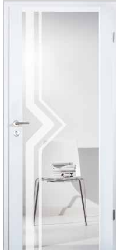
2501 mit dreiseitigem Fries Glas Dekor Weimar