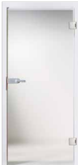
Basic 2 Mastercarré