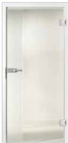
Basic 29-4 Satinato/Klarglas/Rille