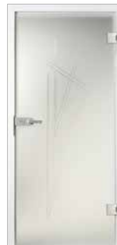
Basic 39-1 Satinato mit Rille

Lassen Sie sich von den Reflexionen und wechselhaften Farbspielen begeistern! Ganzglastüren können kunstvolle Motive tragen, edle Schriffe erhalten oder mattiert auftreten. Sie schaffen Verbindungen und sorgen dennoch auf elegante Art und Weise für eine räumliche Trennung.