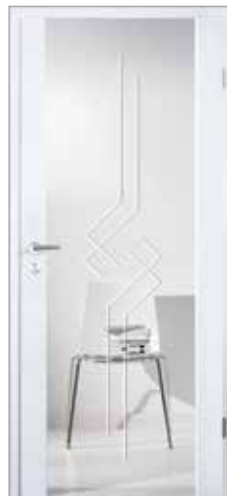
2500 mit Fries längs Glas Rillenschliff