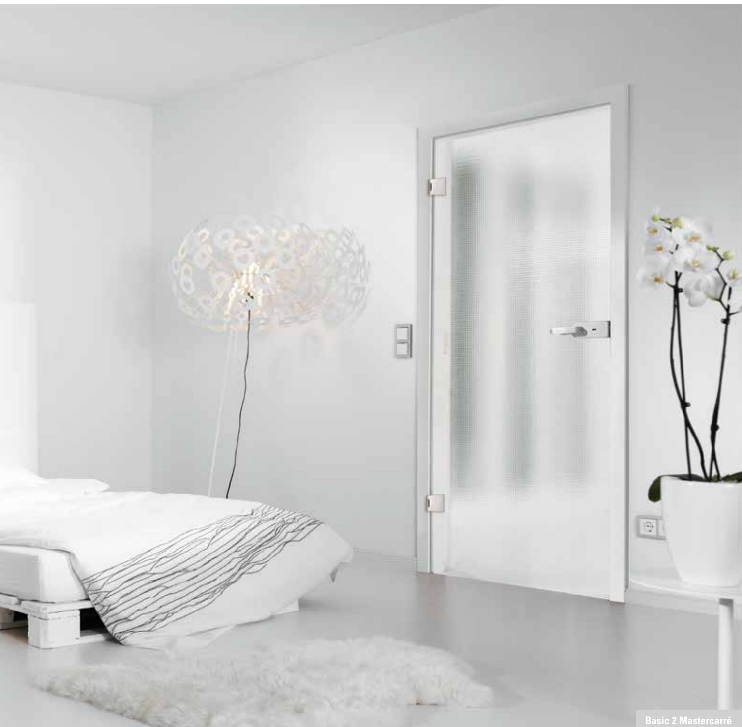
Basic 2 Mastercarré

Klassik trifft auf Moderne und verbindet sich zu einem hochaktuellen Türdesign. Ob klar, satiniert oder mit Siebdruck: Basic 2 ist Glas pur – und das in seiner schönsten Form.