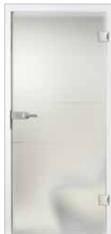
Basic 29-5 Satinato mit Rille