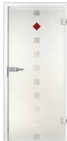
Basic 59-2 Klarglas/Satinato/Siebdruck