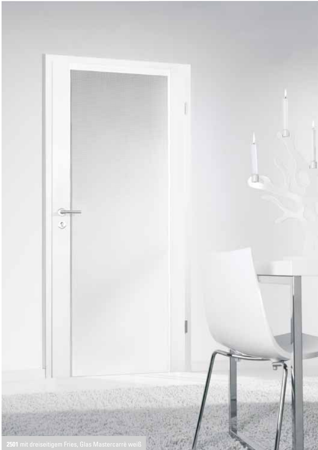
2501 mit dreiseitigem Fries, Glas Mastercarrè weiß

Wenn Holz sich zum Begleiter reduziert und dem Glas den Vortritt lässt, entstehen Türen von starker Aussagekraft und großzügiger Gestaltung. Die Vielfalt an Designgläsern und die optionalen Querfriese vereinen sich zu anspruchsvollen Türbekenntnissen.