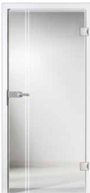
Lombardo 29-16 Weißglas