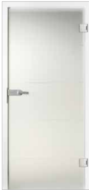
Basic 2, 4 Streifen Satinato