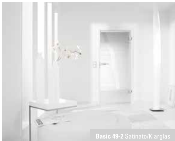
Basic 49-2 Satinato/Klarglas