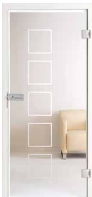
Satura 16-35 Weißglas