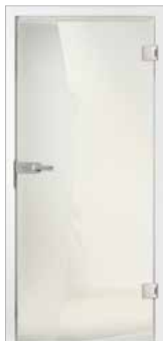
Basic 49-1 Satinato/Klarglas