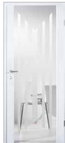
2500 mit Fries längs Glas Visa klar